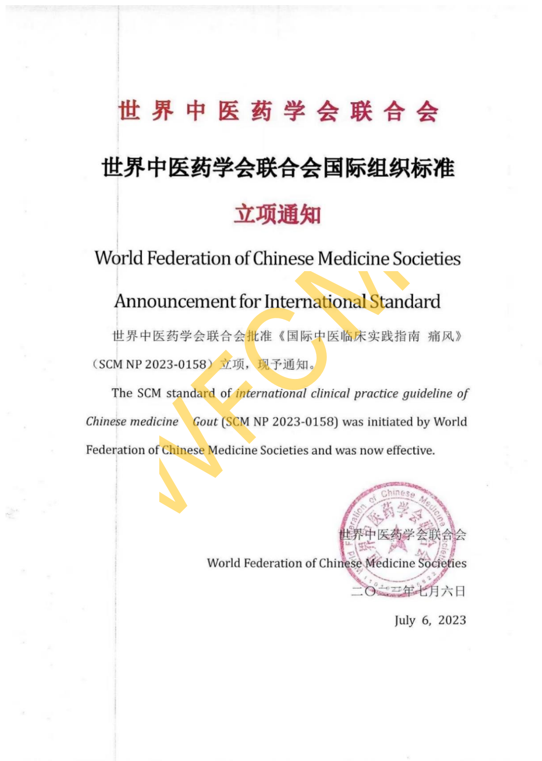
图 1. 世界中医药学会联合会国际组织标准立项通知

《国际中医临床实践指南 痛风》项目于 2022 年 9 月由浙江中医药大学温成平教授联合海内外多学科专家向世界中医药学会联合会发起立项申请，并于 2023 年 7 月 6 日由世界中医药学会联合会批准立项，见图 1。